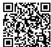
永和のスマホ対応サイト