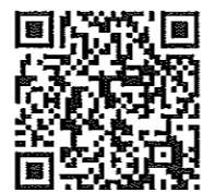
永和のスマホ対応サイト